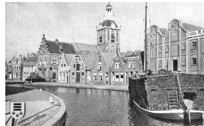
Schepen vervoeren 'bruin goud' door de grachten van Meppel. Werk voor de Meppeler schippers en de stad wordt rijk van het tolgeld.