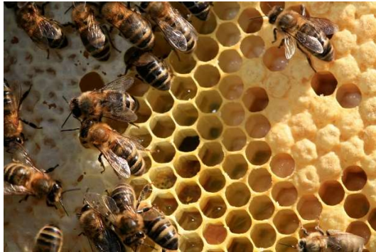
Poepjes. Geurige verlichting voor de rijken