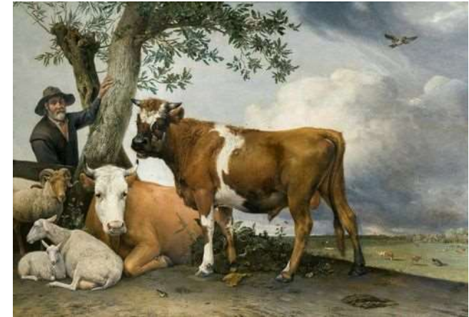
Goedkope verlichting, maar het stinkt wel!