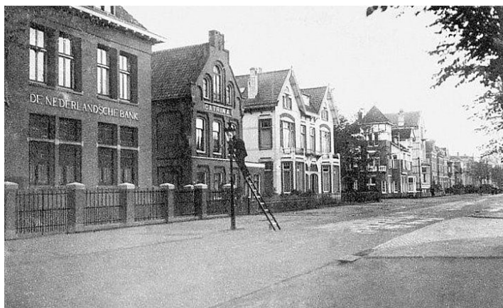
Zie hier een lantaarnopsteker aan de Stationsweg in Meppel. Hij gebruikt biobrandstof, dat uit plantenzaden wordt gehaald door de olieslager. Deze verbouwt vlas en rapzaad.